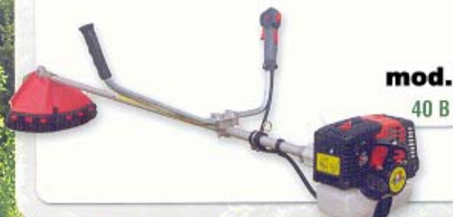
mod. 40 B